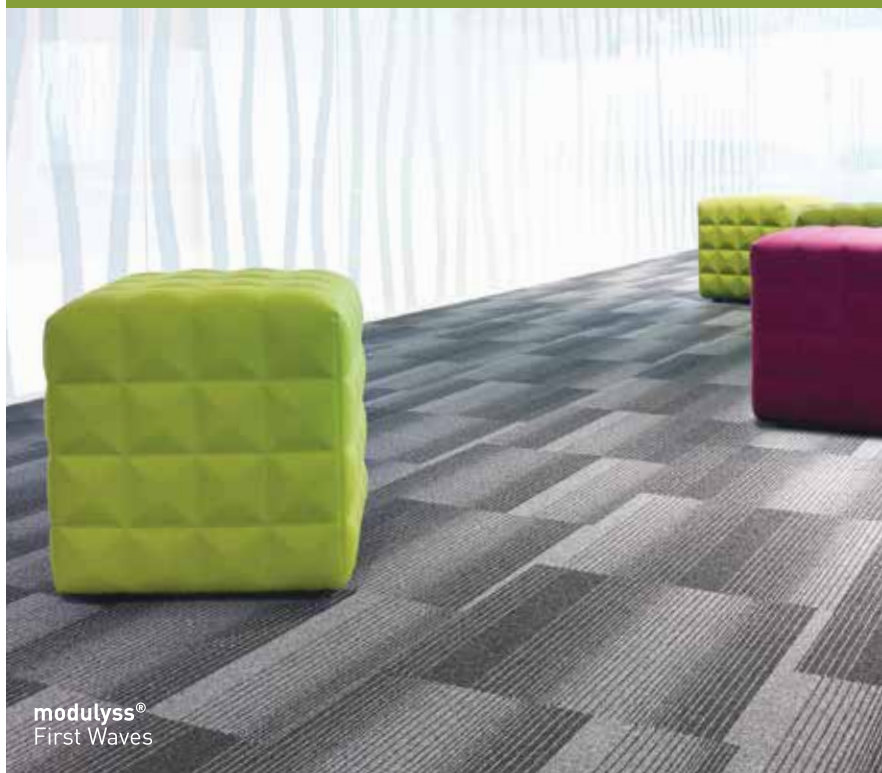
modulyss® First Waves

La moquette fait aujourd'hui respirer la maison grâce aux prouesses technologiques des fabricants. Des moquettes qui jouent à la fois la carte déco et le côté santé de par leur texture et leur aspect soyeux.