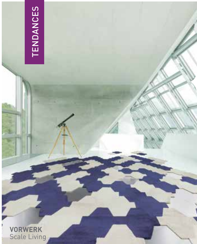
VORWERK Scale Living