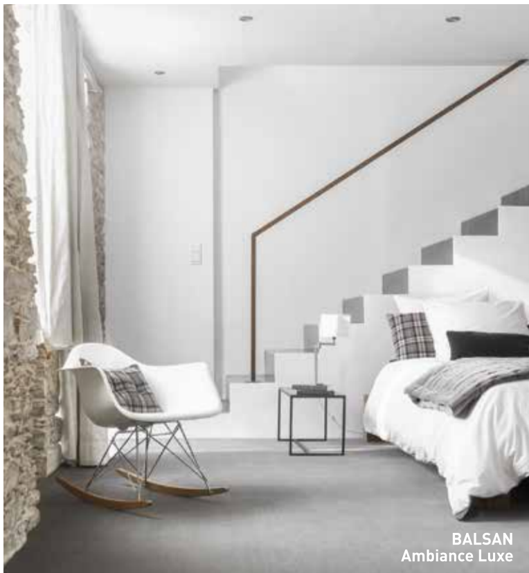
BALSAN Ambiance Luxe