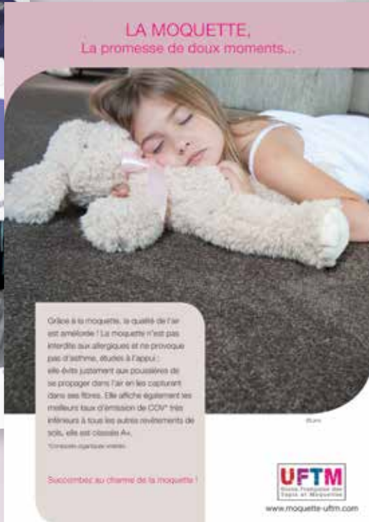
Annonce presse Entretien