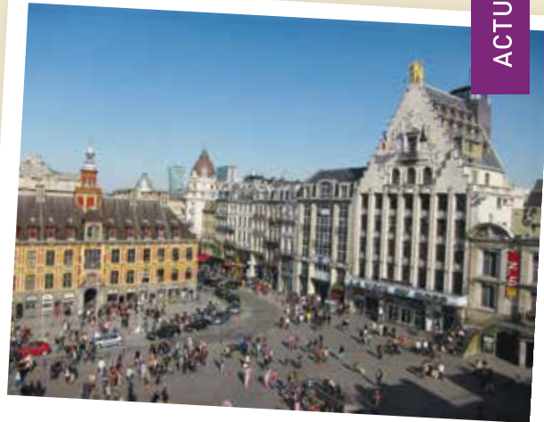
La Grand Place de Lille