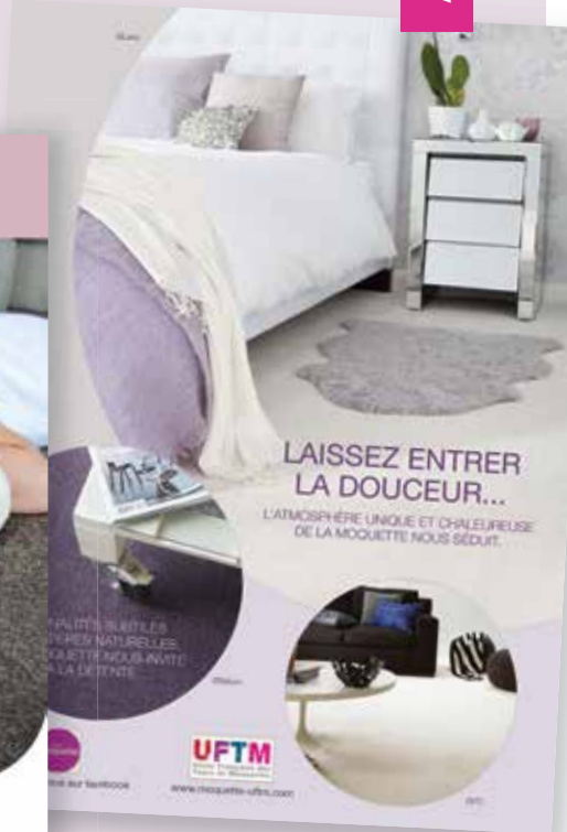
Annonce presse Secteur Résidentiel