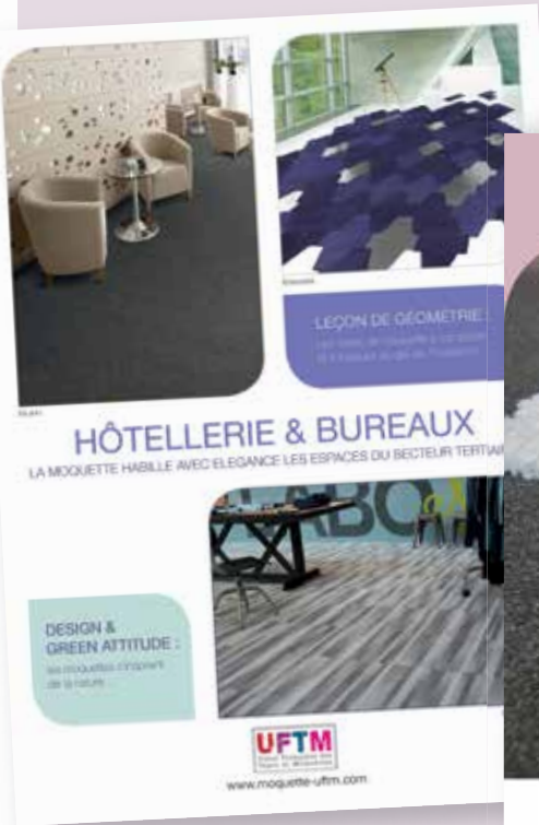
Annonce presse Secteur Contract