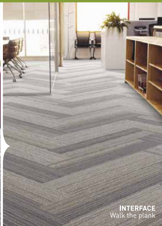
INTERFACE Walk the plank