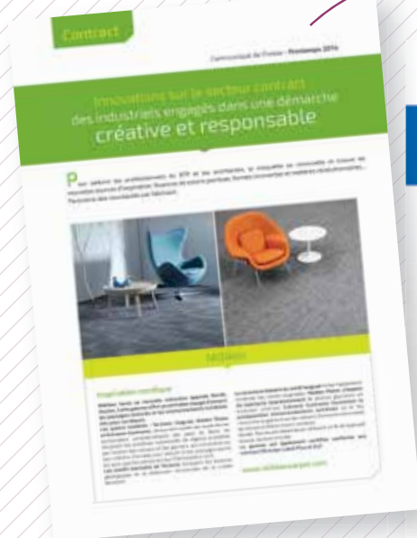
Secteur Contract et Résidentiel Printemps 2014