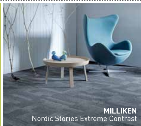
MILLIKEN Nordic Stories Extreme Contrast